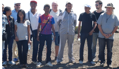
Gruppenfoto nach Vulkanbesuch.

Bericht in der November-Ausgabe 2012 von IM Otto Boriks Zeitschrift „Schachmagazin 64“: