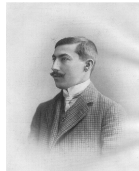
Akiba Rubinstein