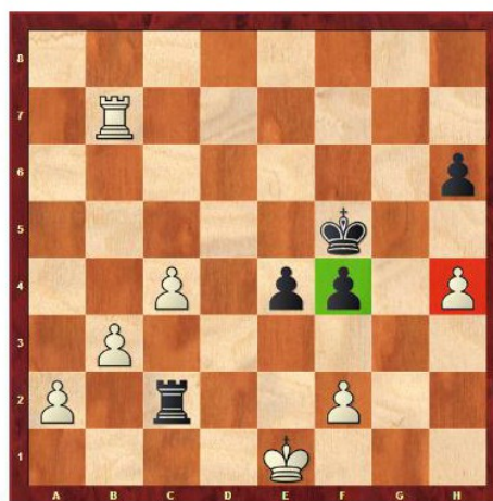
Neymann – Weber Stuttgart 2013

46.a4 Kg4 47.a5 Kf3 48.Tf7 Te2+ 49.Kd1 Txf2 50.c5 e3 51.Te7 Tf1+ 52.Kc2 e2 53.b4 e1D 54.Txe1 Txe1 55.a6 Kg4 56.b5 f3 57.a7 Te8 58.b6 f2 59.b7 f1D 60.b8D Dc4+ 0–1