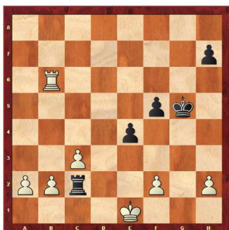
Tarrasch – Rubinstein San Sebastian 1911

36.Tb5! Kg4! 37.h3+! Kxh3 38.Txf5 Txb2 39.Tf4 Txa2 40.Txe4 h5 41.c4 Kg2 42.Tf4 Tc2 43.Th4 Kf3 44.Kd1 Txf2 45.c5 Ke3 46.Txh5 Kd4 ½–½