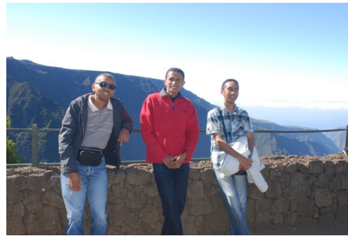
Spieler aus Madagaskar.