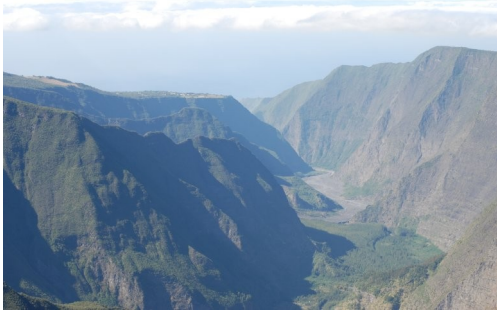
Auf dem Weg zum Krater Bellecombe.